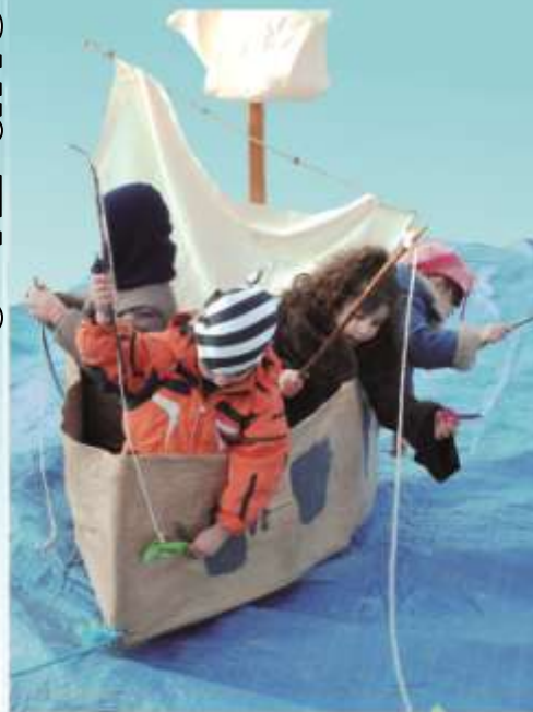
Avec la participation de la Commune de Neuf Brisach