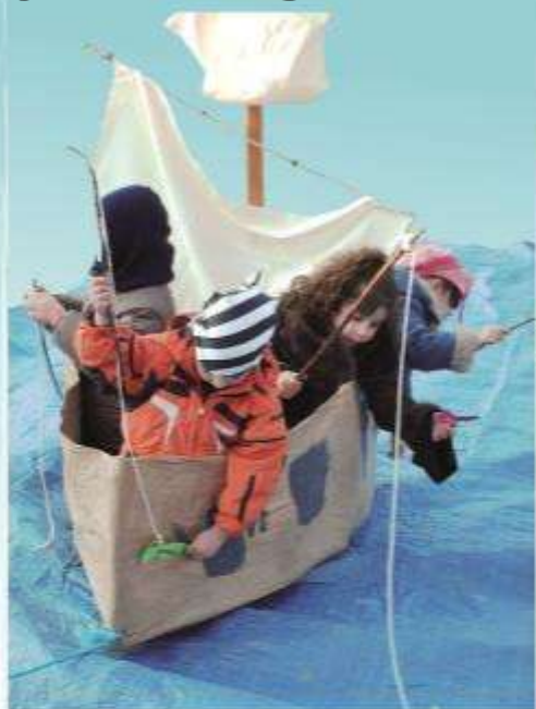
Avec la participation de la Commune de Jebbsheim