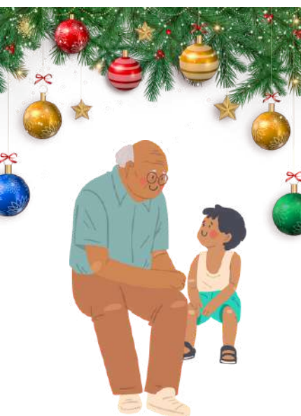
Rencontre à la fête de Noël des personnes âgées du village