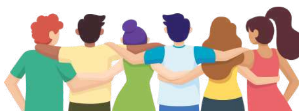
Création de l'espace 8-11 ans