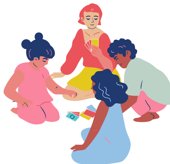
Soirée jeux parents/enfants