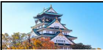
O s a k a

Une aventure au goût de thé fruité en dégustant des petits plats avec tes baguettes 😊