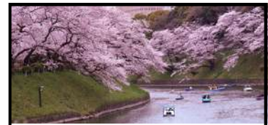
T o k y o