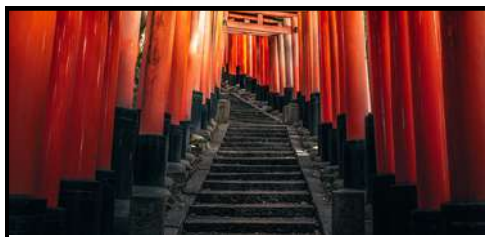
K y o t o