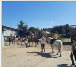
BALADE A PONEY