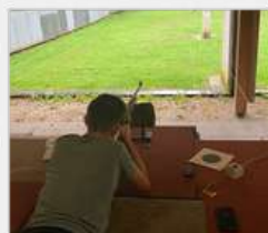
STAND DE TIR